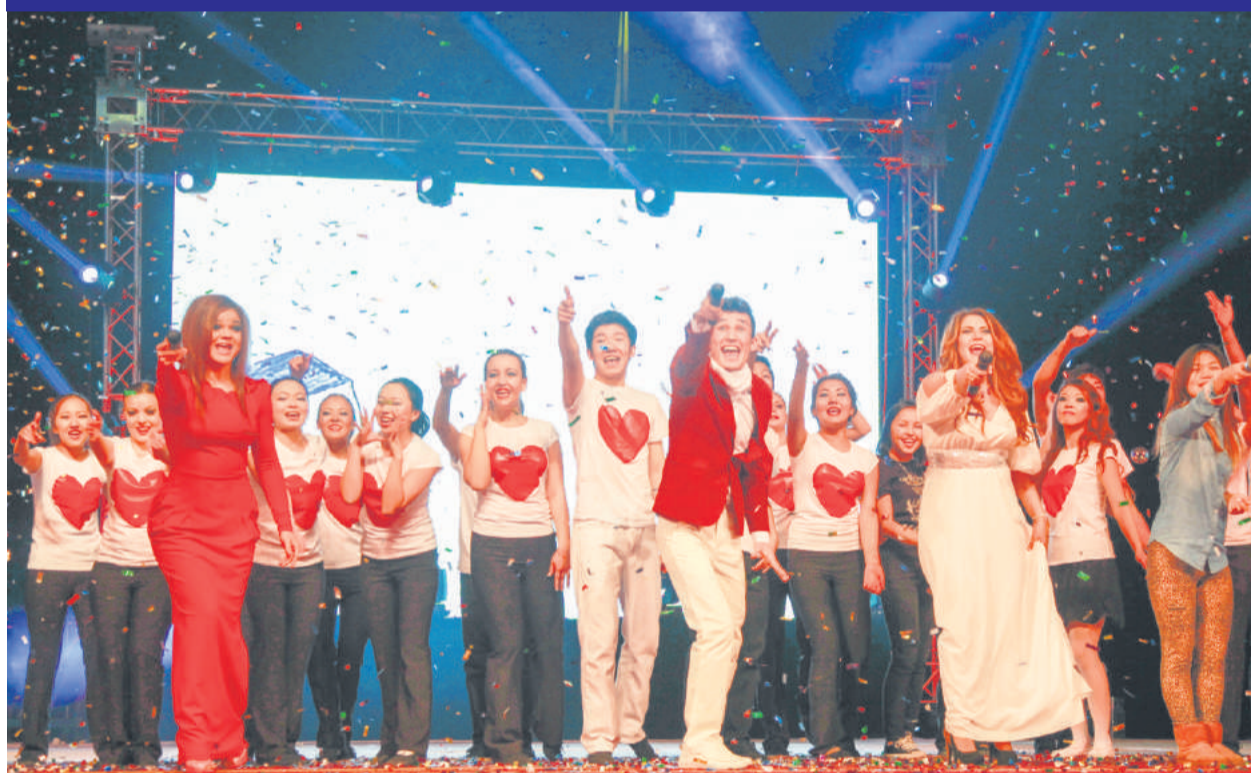
Initiation 2013 p. 4-5