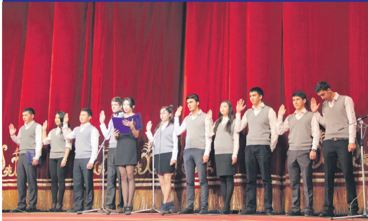
Welcome Student Senate 2013-1014 p. 2