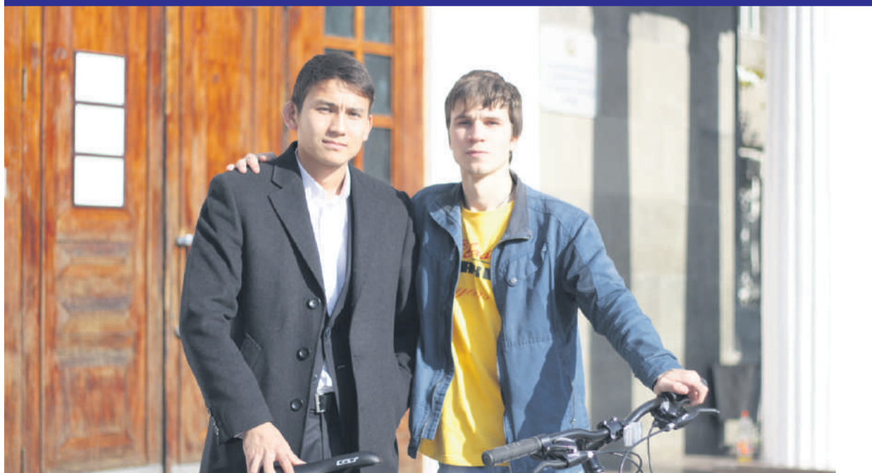
I give up smoking p. 3