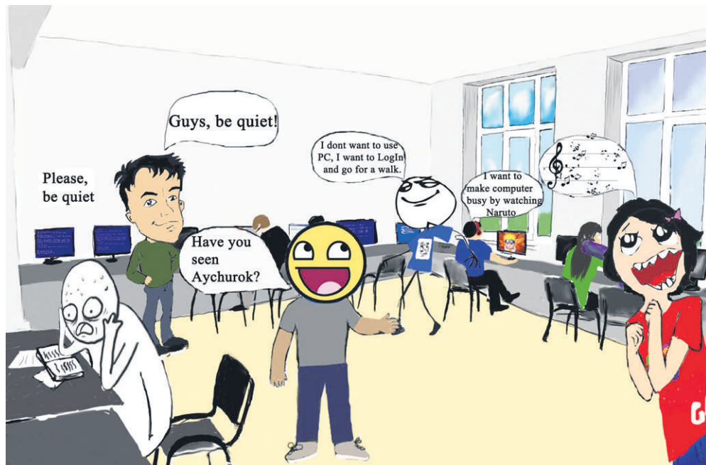
Meanwhile in the dorm lab... by Diana Khegai and Arslan Gabdulkhakov