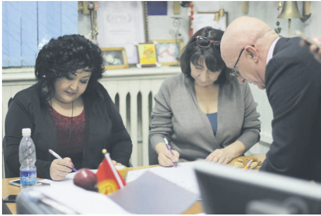
Обсуждение судейской коллегии