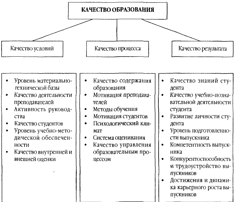
Рис. 2. Структура качества образования

Качество результата можно рассматривать как систему, состоящую из следующих элементов: