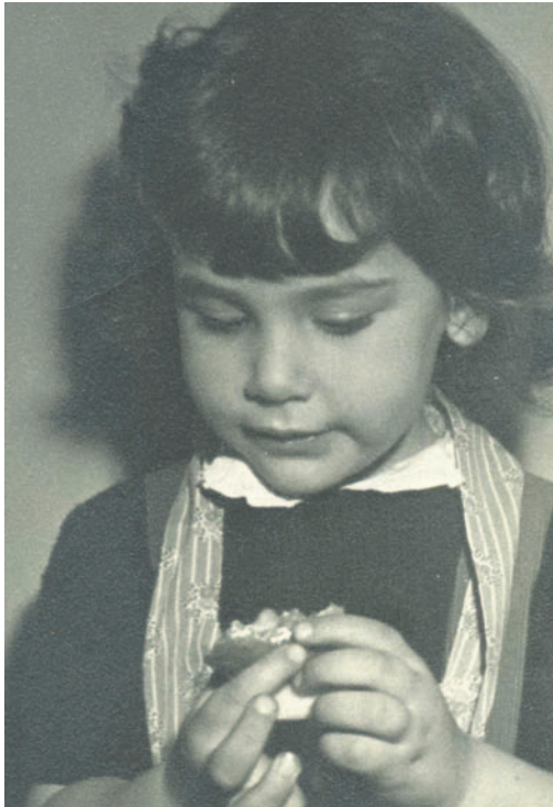
when I was 2,5 years old

When one stops learning, you know, one stops growing. And I never want to stop. AUCA has taught me to appreciate new ways of thinking about problem solving and new ways of explaining how things work or might work. It has taught me that for a university in the developing world to sustain a thoughtful and exciting learning atmosphere we need to articulate our core assumptions about learning and to plan our way to turning those assumptions into reality. It has taught me to stand up for our values and mission and to teach others to do the same. It has taught me to keep a good sense of humor and proportion when the best laid plans go awry from unforeseen circumstances beyond our control. It has taught me how very important it is for our students to be active participants in the decision making at our university.