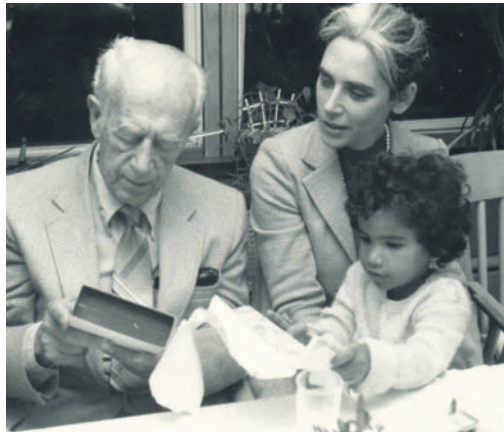
with my daughter and late uncle